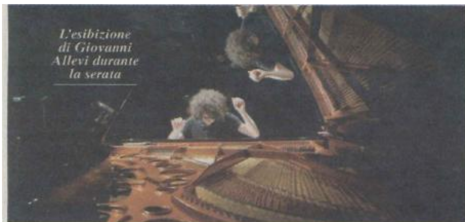
L'esibizione di Giovanni Allevi durante la serata

Infine il premio Lombard Elite è stato assegnato alle aziende, agli imprenditori e ai professionisti e