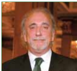
Roberto Coin (Roberto Coin)