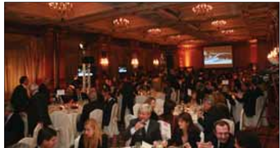
Oltre 200 gli imprenditori presenti all'Hotel Principe di Savoia

Infine, le aziende italiane che hanno realizzato le migliori perfor-