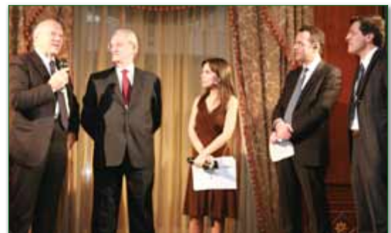
Un momento della serata